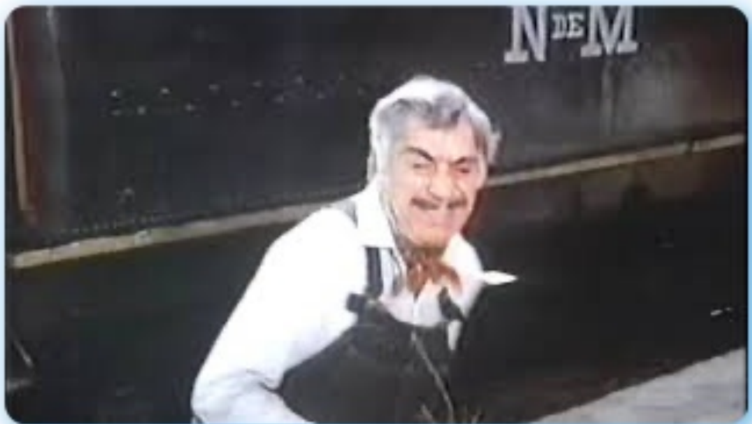
Luis Aguilar a sus 70 años de edad actuando en la película “La Rielera” - 1988.