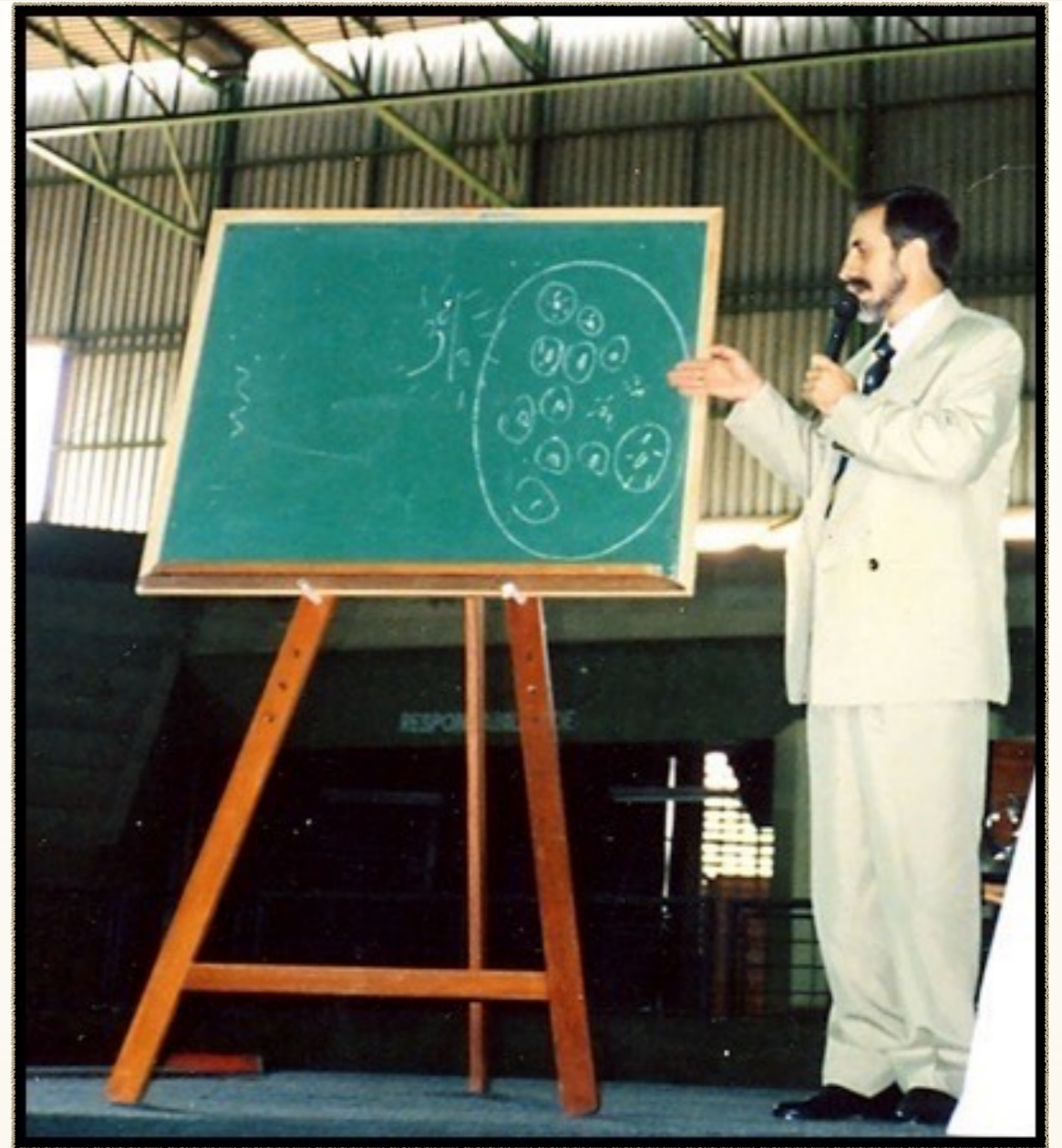
El Bodhisattwa del V.M. Thoth-Moisés en Misión Gnóstica en la Ciudad de Florianópolis, Brasil, en el Año de 1996.