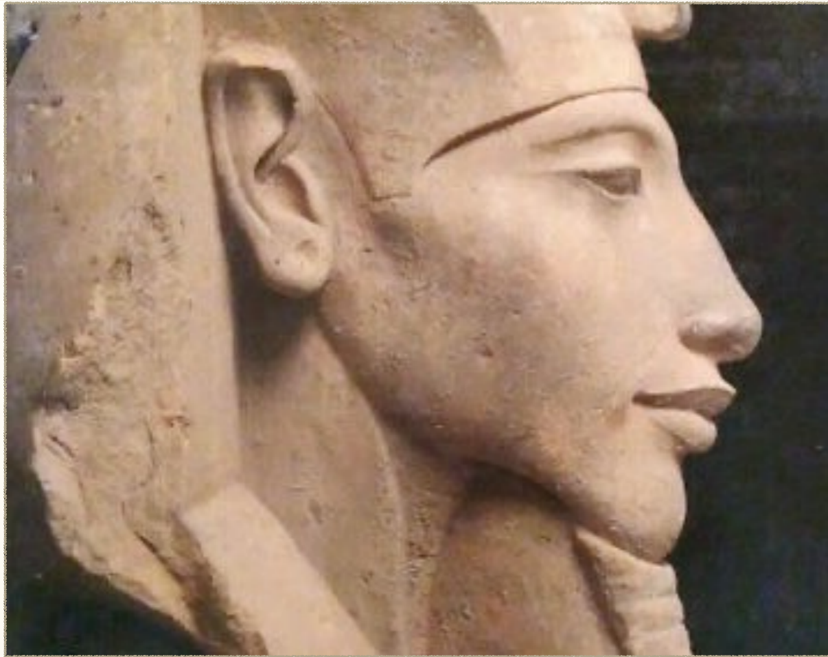
El Faraón Akhenatón