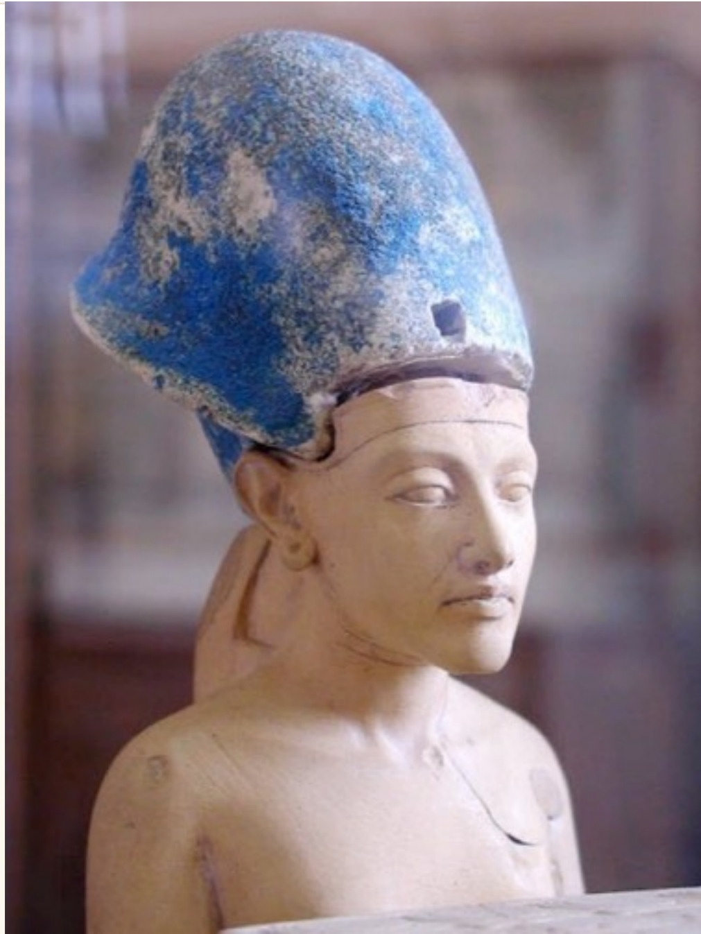
El Rostro de Akhenatón en su adolescencia