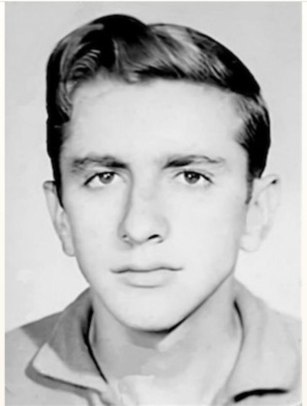
El Bodhisattwa del V.M. Thoth-Moisés en su adolescencia