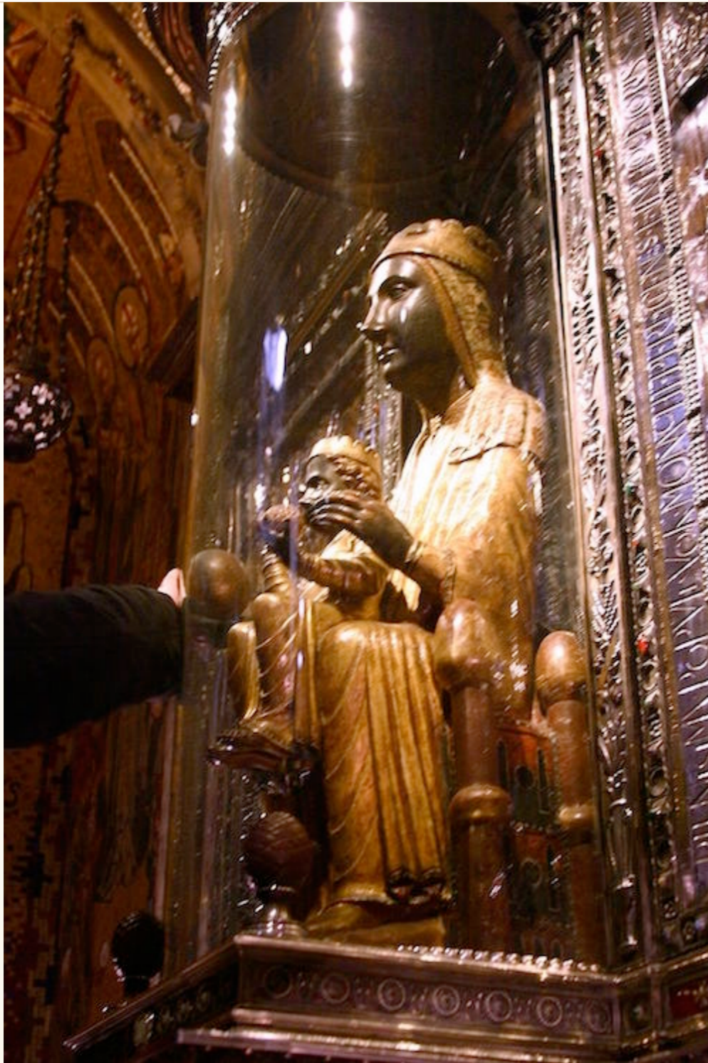
- LA VIRGEN NEGRA DE MONTSERRAT -

Este Estudio lo terminé de escribir con la Ayuda de Dios en la Víspera del Shabbath del Viernes 24 de Mayo de 2019.