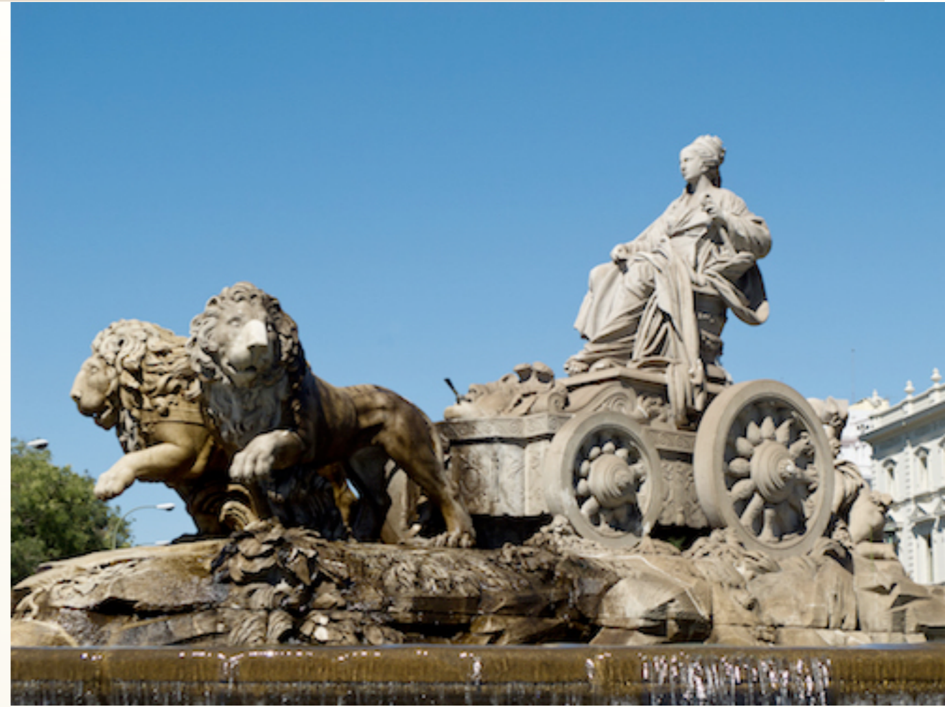
- "La Fuente de la Cibeles en Madrid" - - "LA CIBELES NUESTRA SEÑORA DE MADRID"

"Pero a vosotros los que teméis Mi Nombre nacerá el Sol de Justicia elevándose con salud en sus alas..." ( Malaquías 3:20 )... ESTE ES EL SECRETO DE LA ILUMINACIÓN DE JOJMÁH..." ( El Zóhar ).