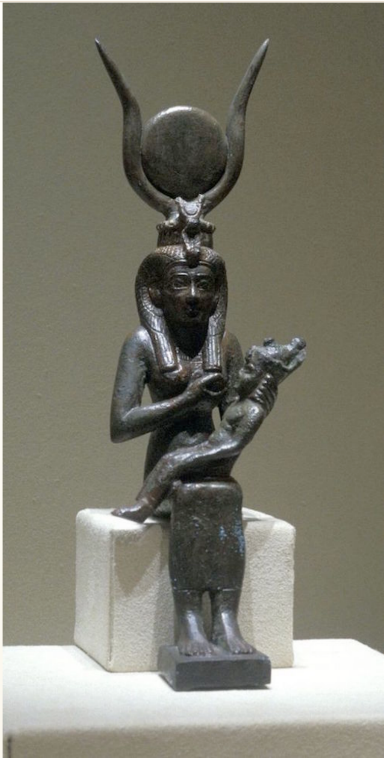
- LA MADRE DIVINA ISIS AMAMANTANDO A SU NIÑO DIVINO EL CRISTO HORUS -