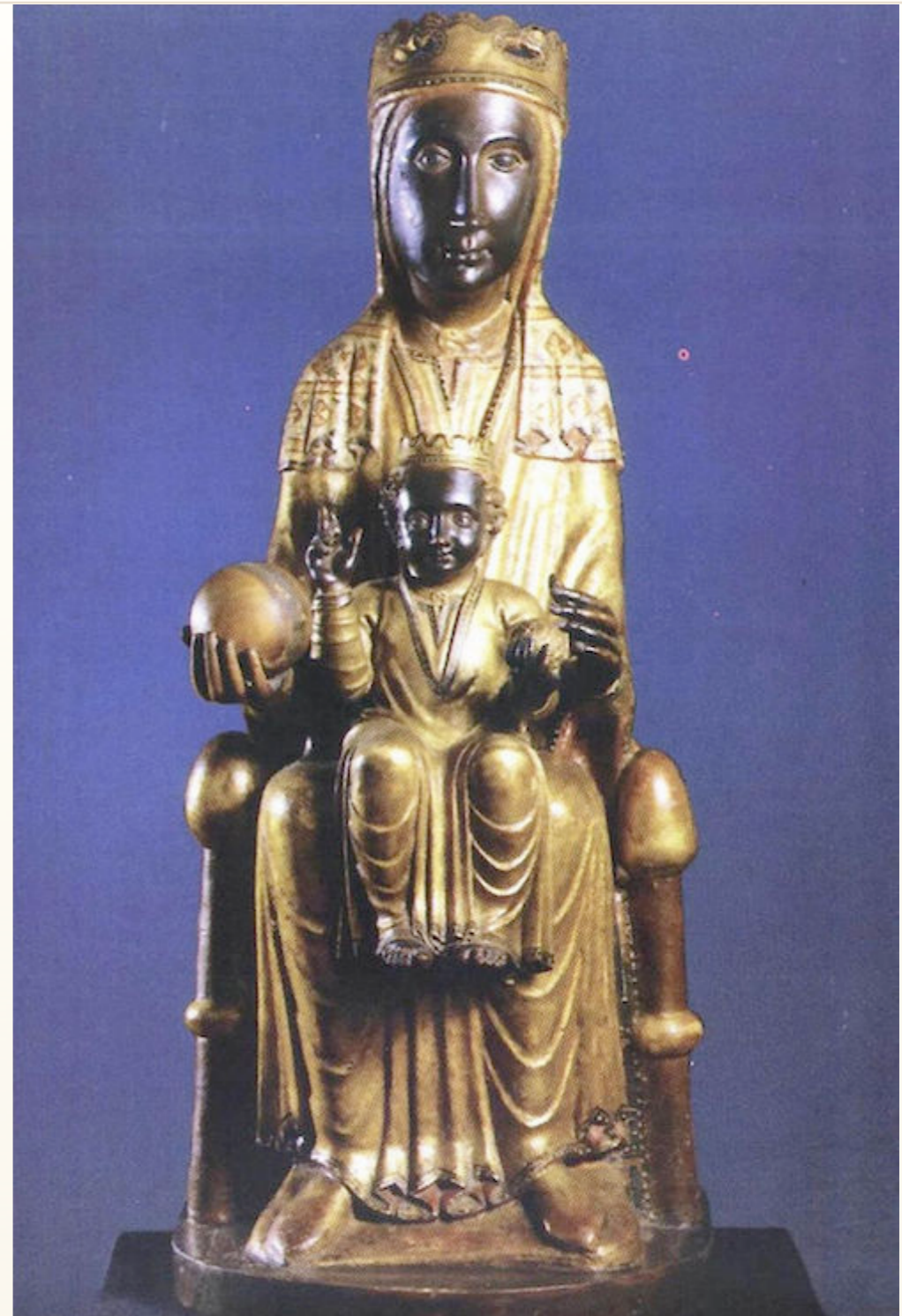
- LA VIRGEN NEGRA DE MONTSERRAT -