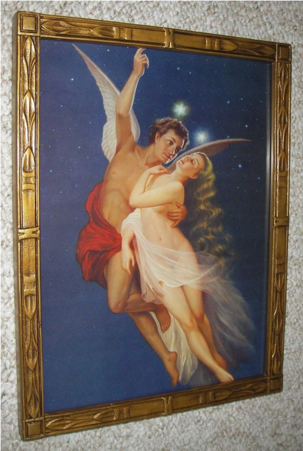
“PRINT Old 1930 era Mexican print titled Amor De Estrellas” (El Matrimonio Perfecto)