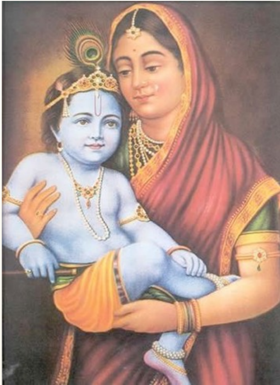
El Nacimiento del Niño Krishna, Chandra-Vanza, Ushanas-Shukra Venus-Uriel o Moisés.