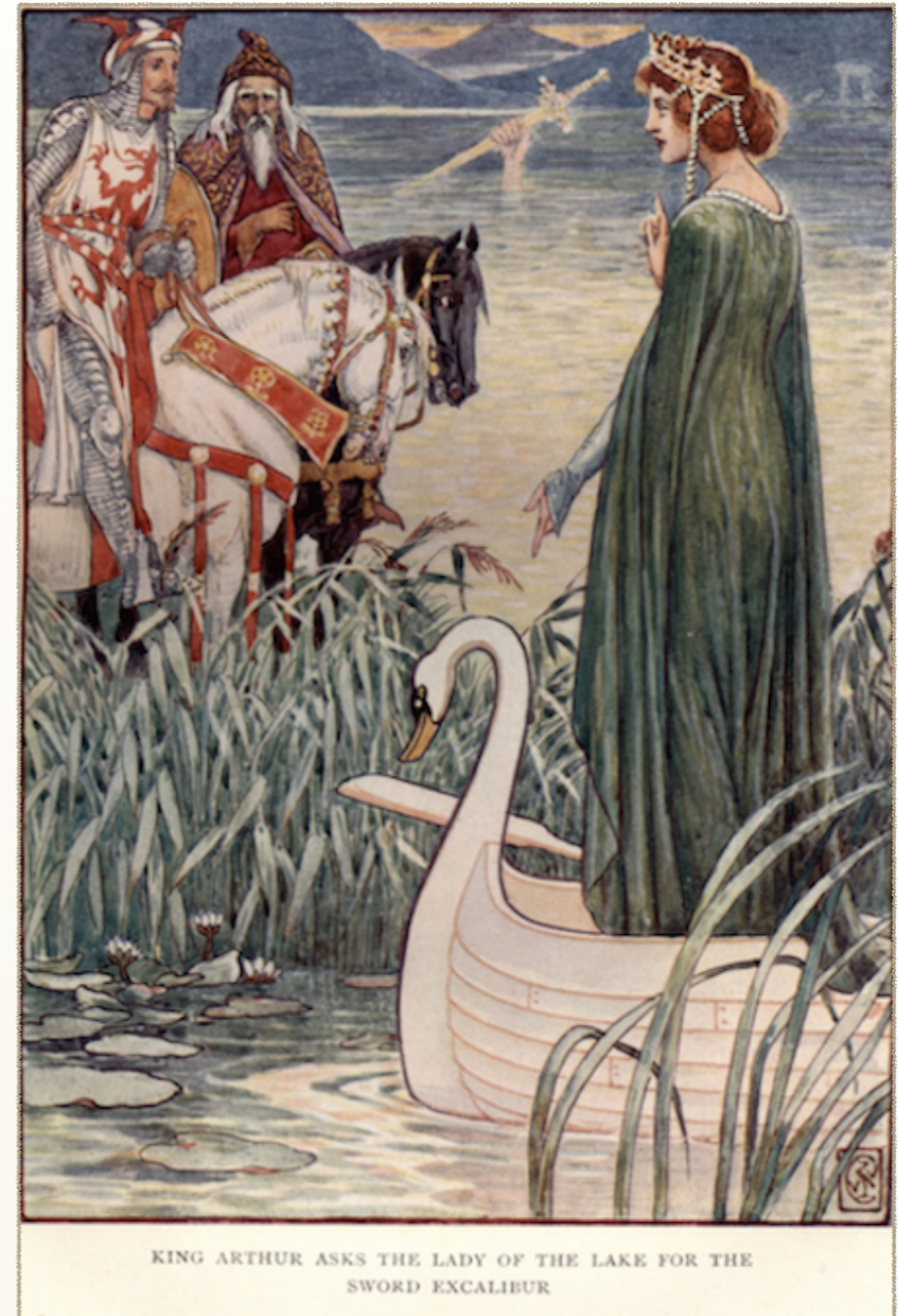
KING ARTHUR ASKS THE LADY OF THE LAKE FOR THE SWORD EXCALIBUR

tiene al Gurú, al Guía, al Maestro, y comienza el descenso, acompañado por el Gurú, a los nueve círculos infernales del Planeta Tierra, así como está en la Divina Comedia de Dante Alighieri.