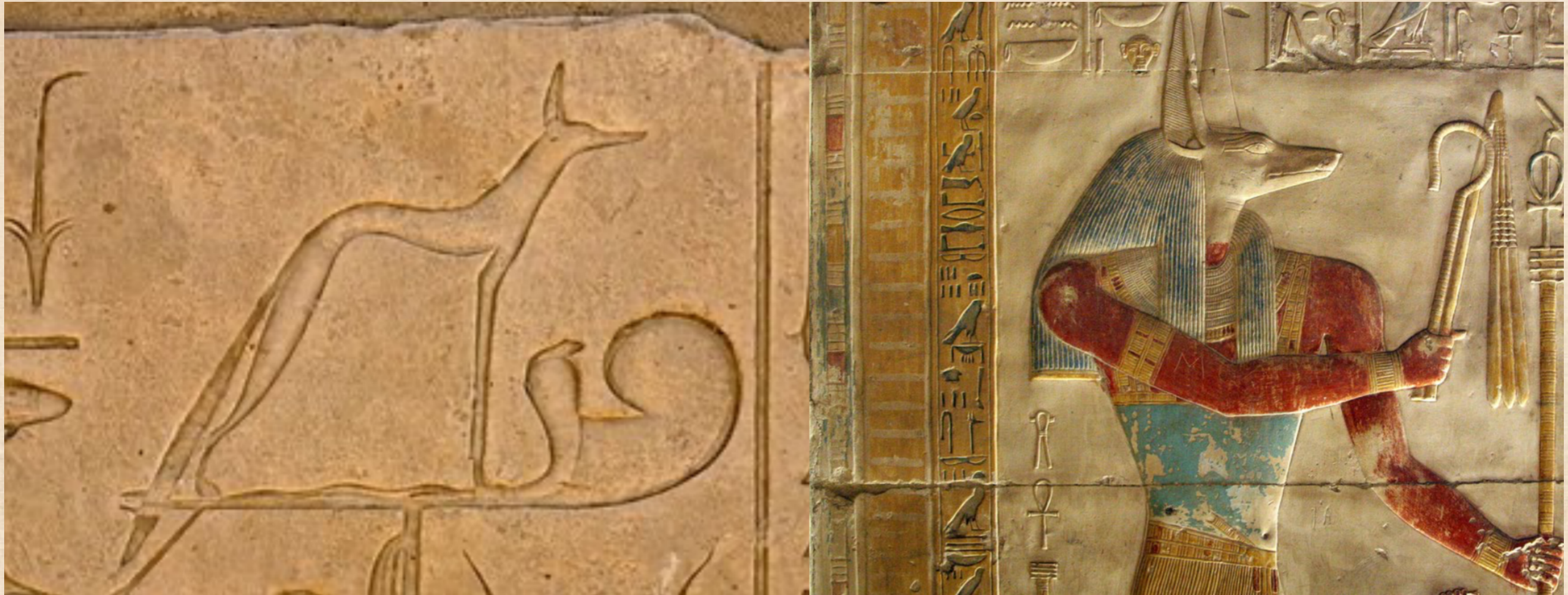
EL DIOS ANUBIS-WPUAWT EL ABRIDOR DEL CAMINO ESOTÉRICO Y EL DIOS PSICOPOMPO CONDUCTOR DE ALMAS