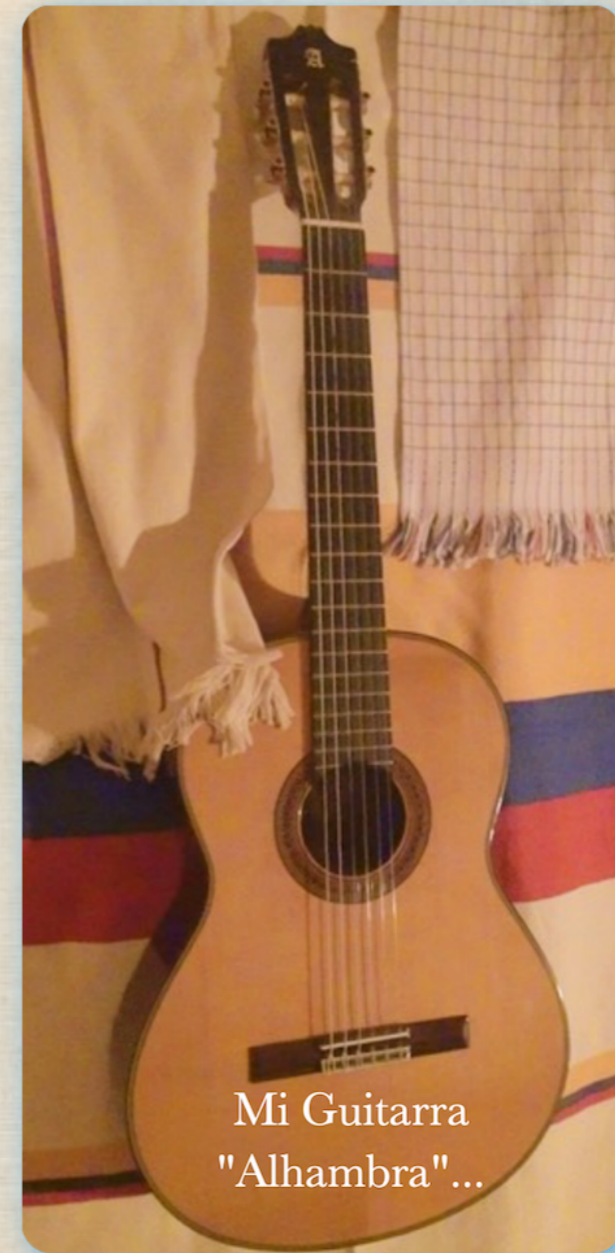
Mi Guitarra "Alhambra"...

http://www.testimonios-de-un-discipulo.com/Acerca-de-Jose-El-Hijo-de-Jacob.html