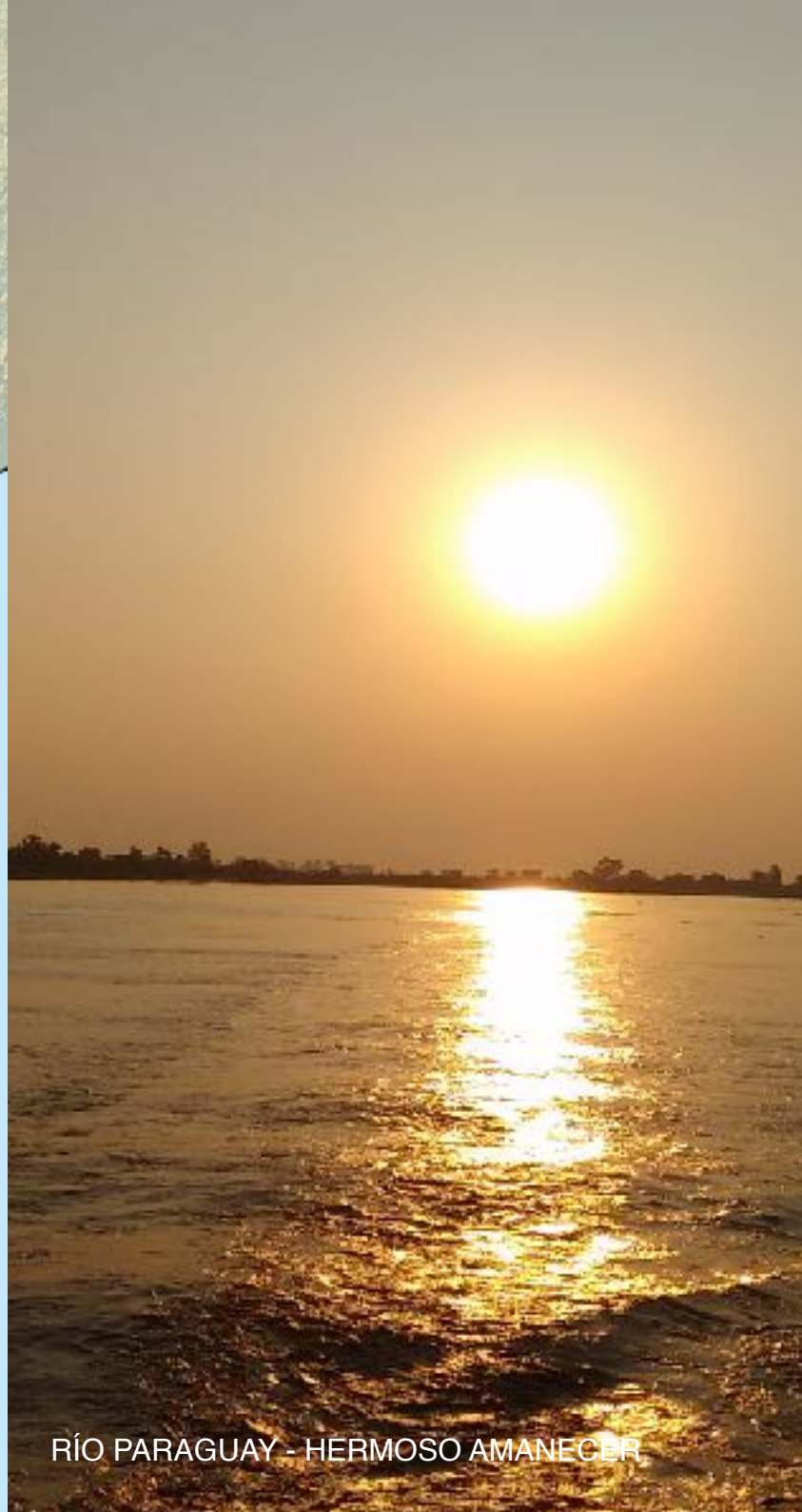
RÍO PARAGUAY - HERMOSO AMANECER