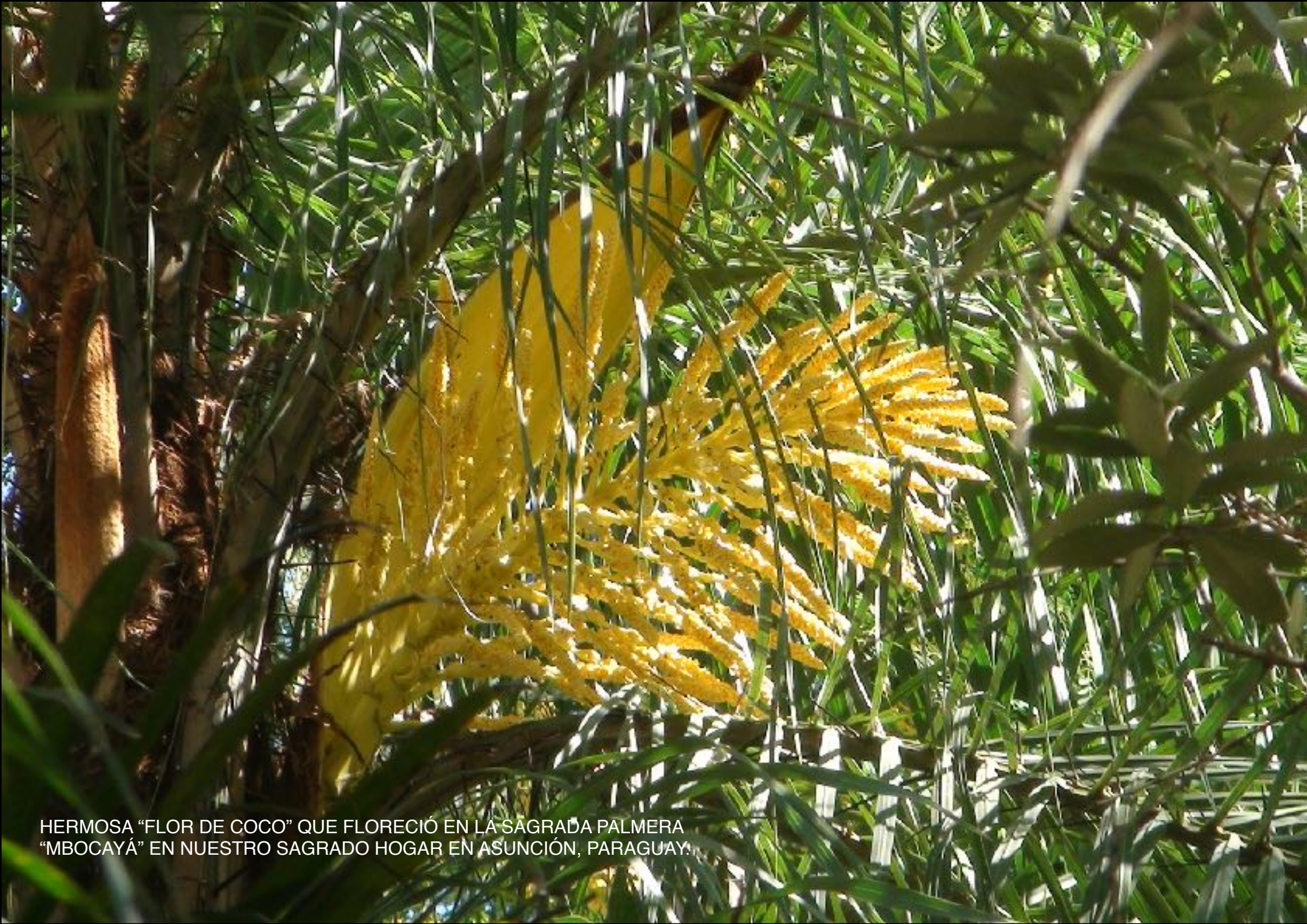
HERMOSA "FLOR DE COCO" QUE FLORECIÓ EN LA SAGRADA PALMERA "MBOCAYÁ" EN NUESTRO SAGRADO HOGAR EN ASUNCIÓN, PARAGUAY.