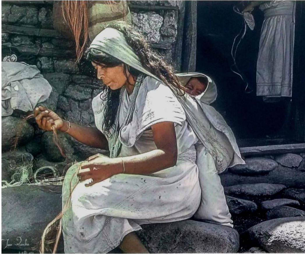
TEJEDORA DE PENSAMIENTO; HUMILDAD Y SABIDURÍA. MAMA ATI-GAWIN