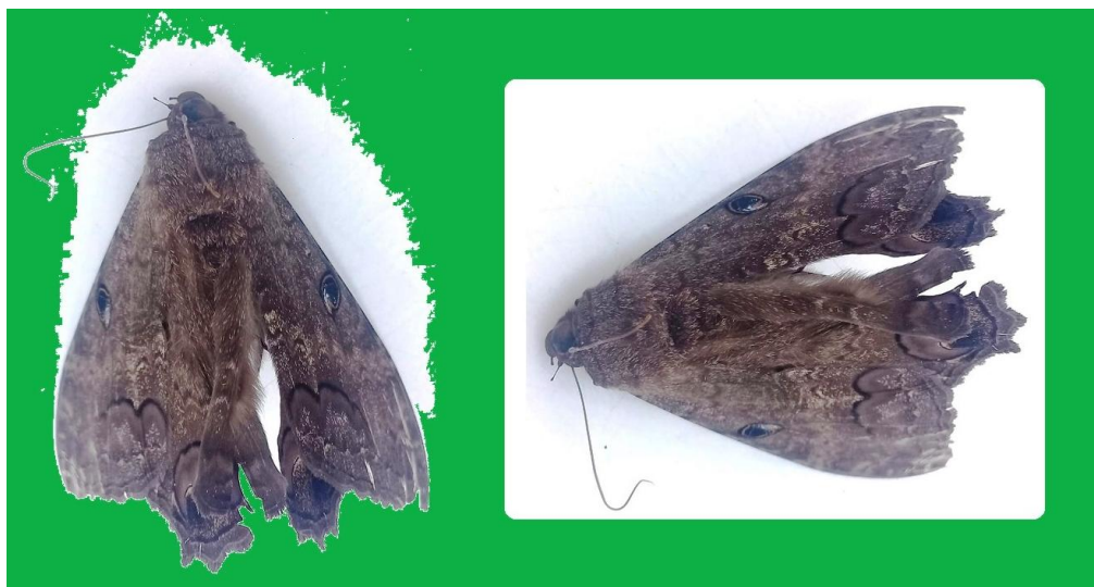
Antiguo KUINTRUN, Mensajero del Poder de la Dualidad Ángeles Espirituales en Potencia