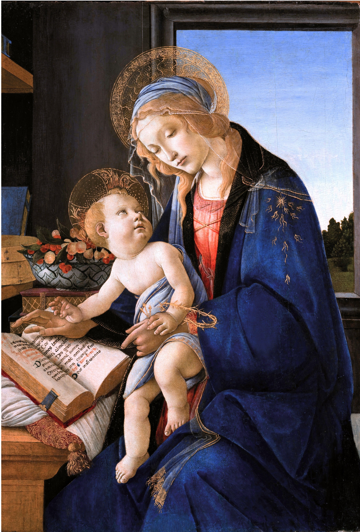
Sandro Botticelli: “The Virgin and Child (The Madonna of the Book)”