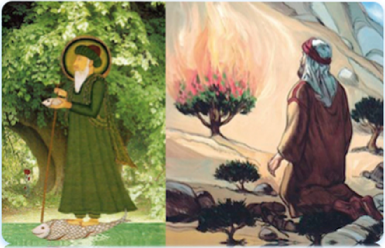
Al-Jadir y Moisés - (Pdf) - Al-Jadir Melkizedek (Pdf)