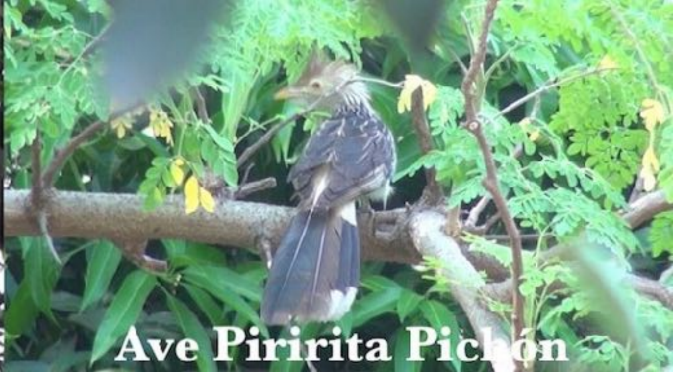
Ave Piririta Pichón