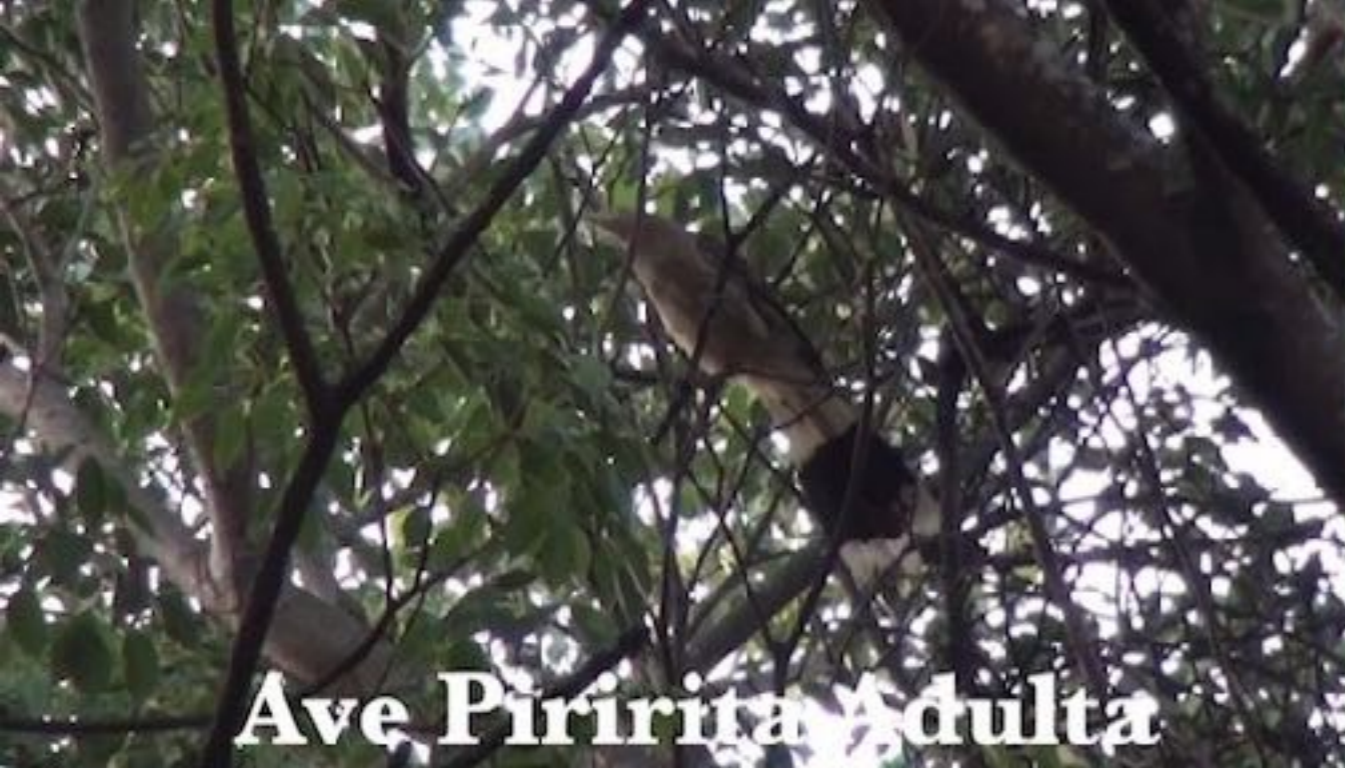
Ave Piririta Adulta