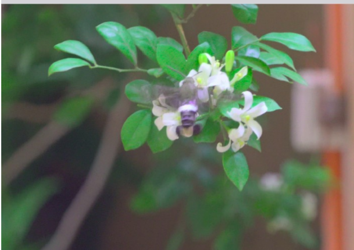
Manifestación de la Sagrada Mariposa Colibrí Esfinge en Nuestro Sagrado Hogar en Asunción, Paraguay, el Día Miércoles, 20 de Enero de 2021.