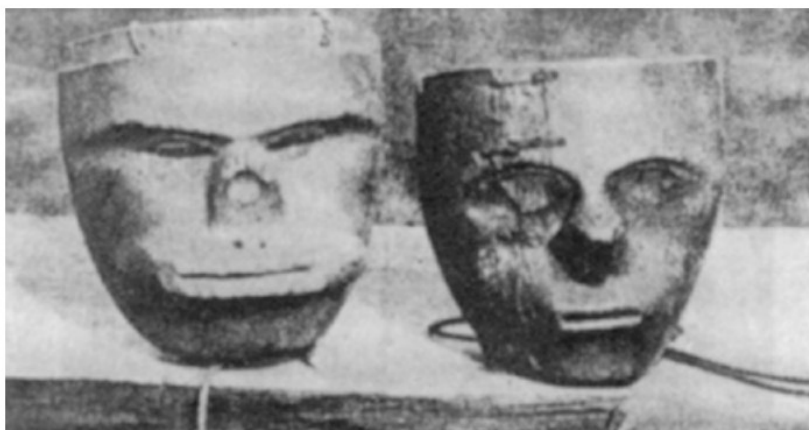
Fig. 22 a, b. Máscaras del sol ( mama Uákai ) y gran máscara solar ( mama Nuikukui uákai o malkultse ) de Noavaka. P. 182

concepción del más elevado Pensamiento Mamo de los Koguis, de las Dos Máscaras Sagradas del Dios del Sol TEIKÚ Y MUGUZHI: “Mama Uákai” y “Gran Máscara Solar “Mama Nuikukui Uákai o Malkuitse” (“MUGUZHI”). “La Gran Máscara del Sol (Mama Nuikukui Uákai)”: