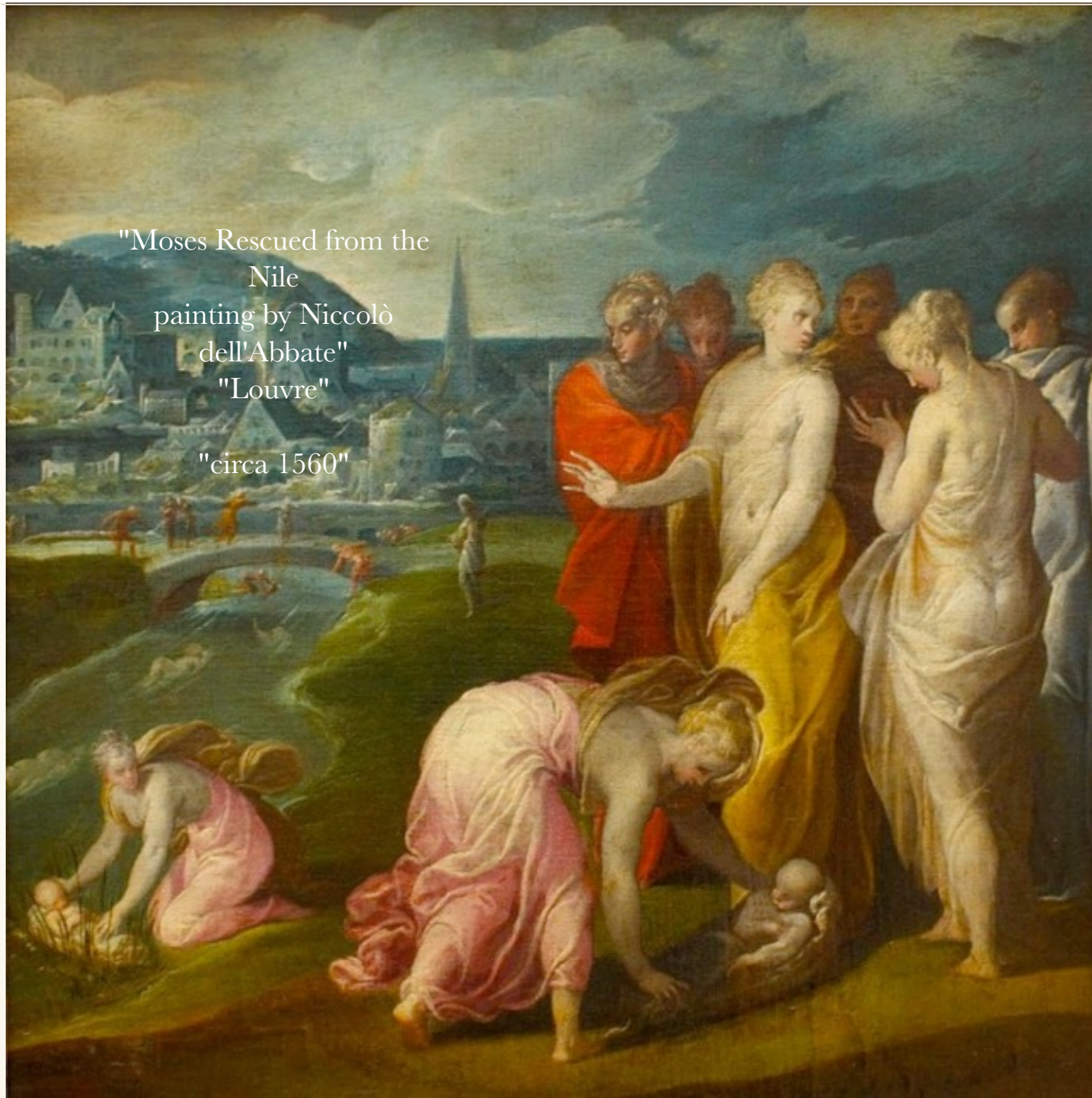
"Moses Rescued from the Nile painting by Niccolò dell'Abbate" "Louvre" "circa 1560"