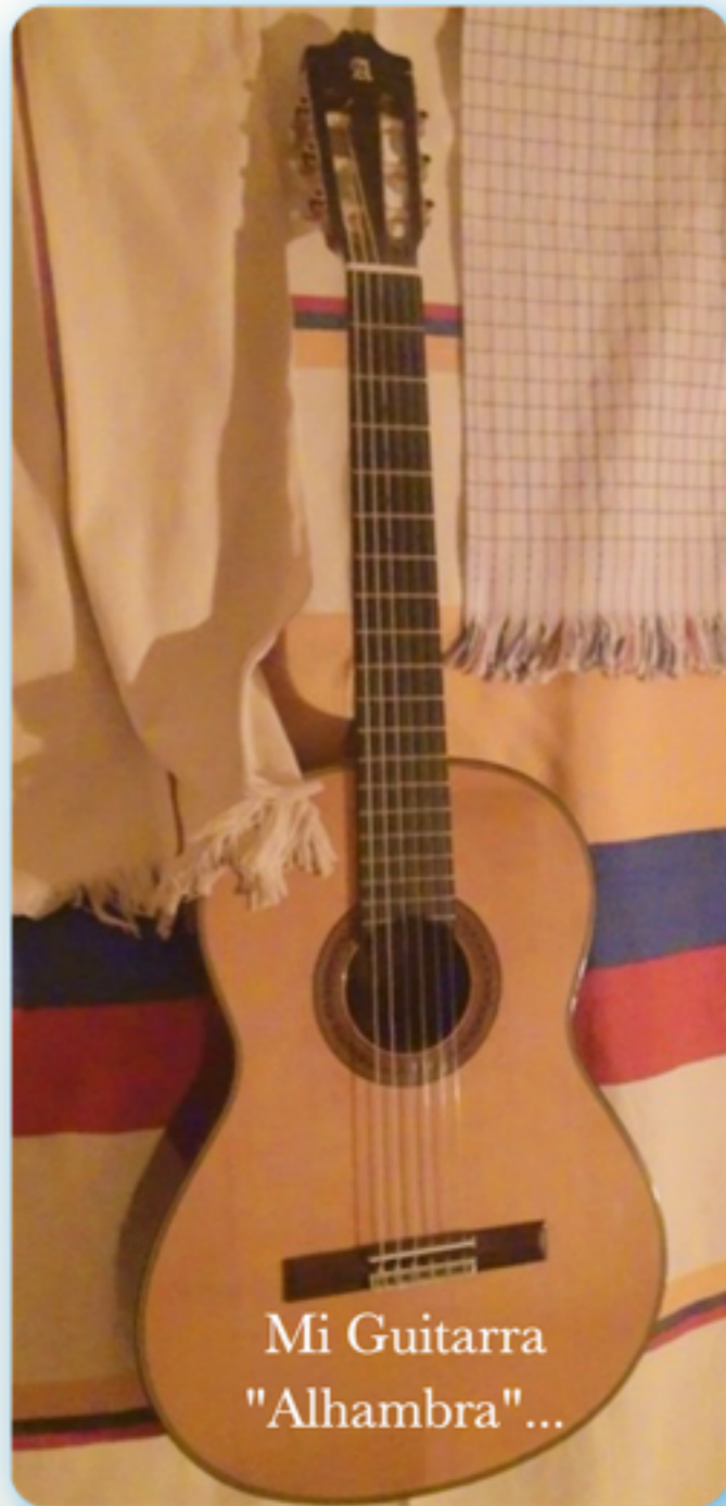
Mi Guitarra "Alhambra" ...