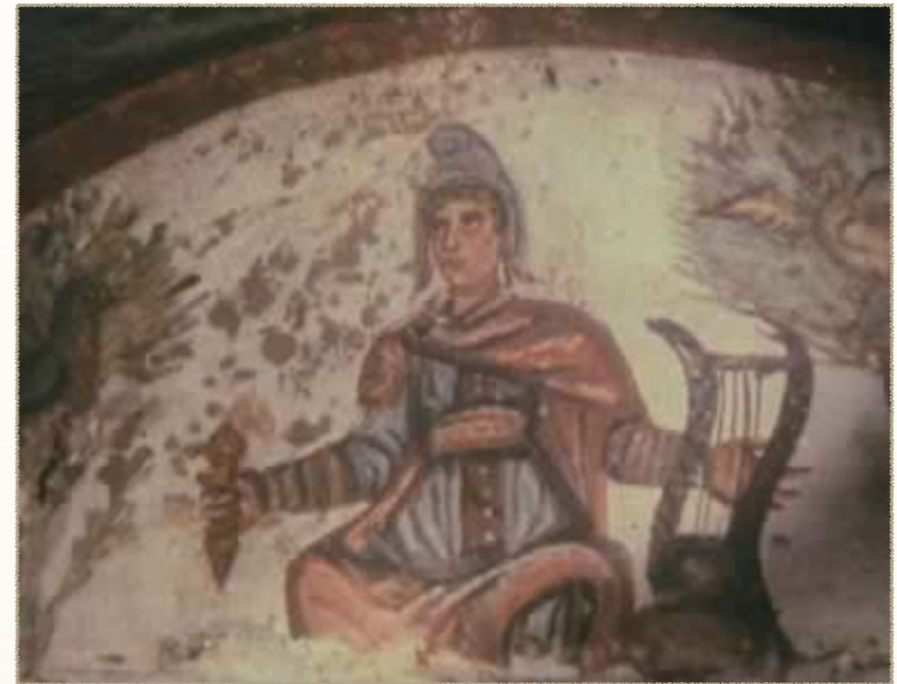
- Cristo-Orfeo en las Catacumbas Romanas -

"Invoco al poderoso Pan, la esencia de el todo, etéreo, marino, terrestre, alma general, fuego inmortal; porque todo el mundo es tuyo y todo son partes de ti [...] esplendor celestial puro [...] Verdadero Júpiter Serpentino con Cuernos... El encendedor... del fuego..."