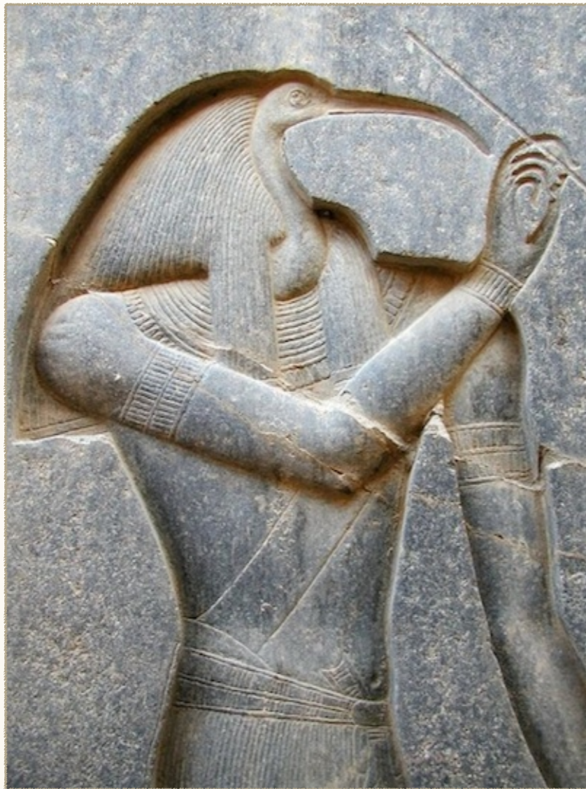
- El Dios Thoth -

"... en Egipto el nombre de 'Thoth' [es el nombre de] el inventor de las Artes y de las Ciencias, de la Escritura o de las letras; de la Música y Astronomía [lo que lo identifica con Apolo el Dios de la Música]..." (H.P.B.)