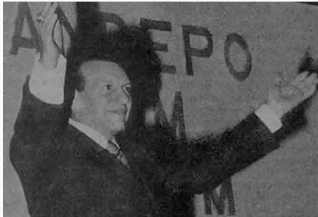
El Cristo Triunfante en Nuestro V.M. Samael Aun Weor, en la Conferencia "Quetzalcóatl", el 9 de Septiembre de 1977 en la Ciudad de México.

Transcripción de la Conferencia “QUETZALCÓATL”, dictada por Nuestro Venerable MAESTRO SAMAE AUN WEOR, el 9 de Septiembre del año de 1977, en el Auditorio Cuauhtémoc Santana de la Ciudad de México: