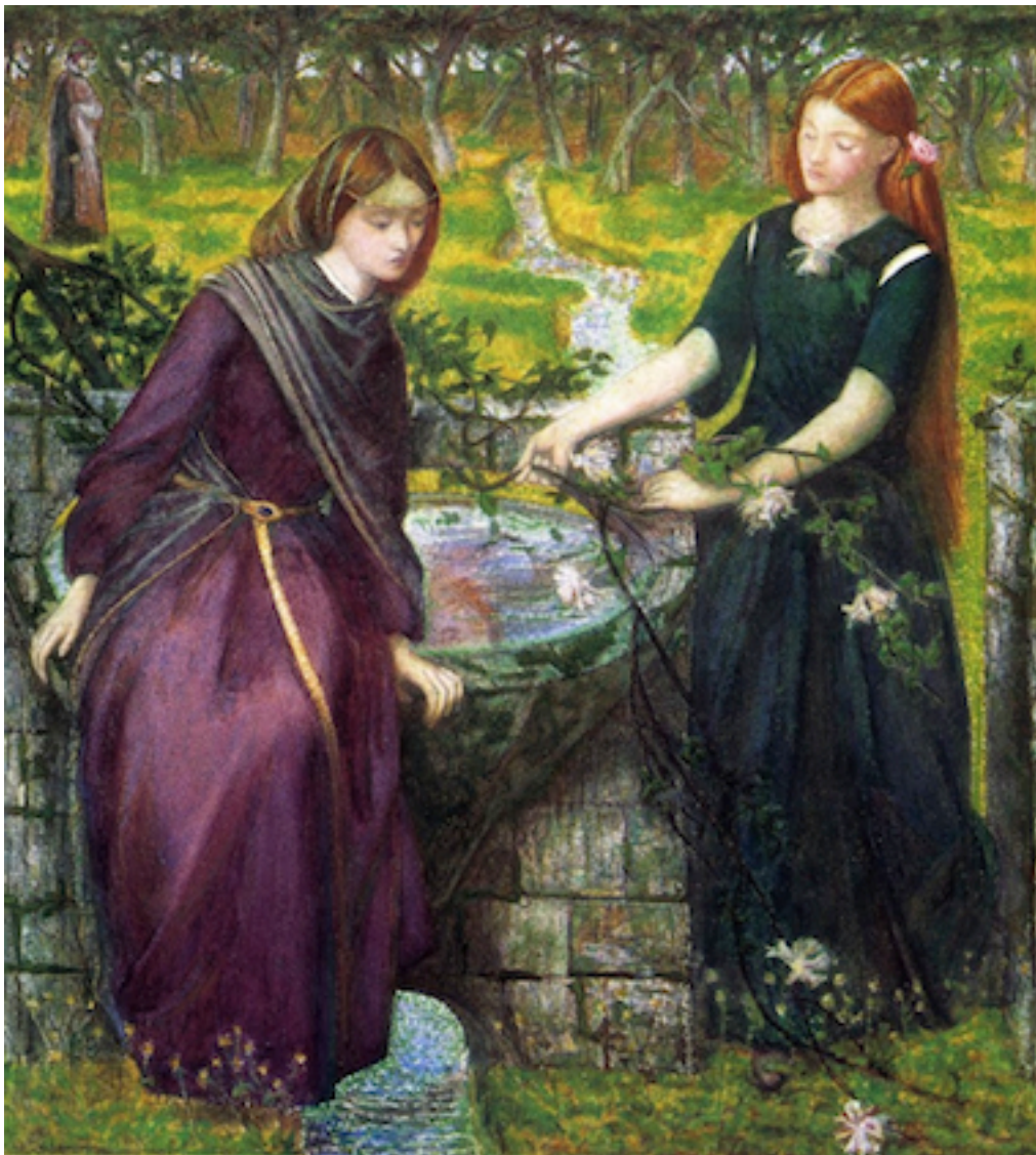
- Rajel y Leáh -

Los " Cincuenta Días " kabalísticamente se refieren a la Madre Divina, Bináh (que significa Entendimiento, Inteligencia), y a la Shejináh Superior (Leáh) " que corresponden al valor numérico de Mi [¿Quién?], cuyo valor numérico es cincuenta. "