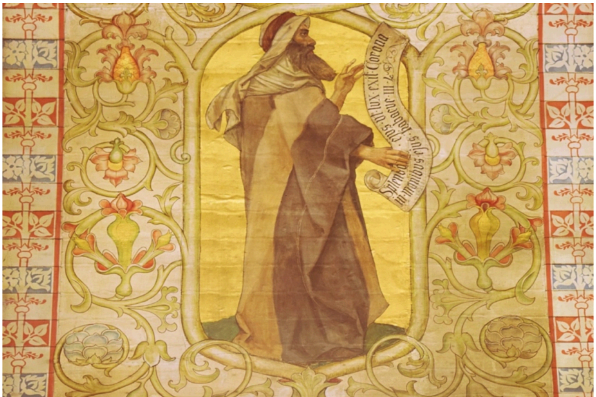
- El Profeta Habakkuk -

Nadav y Avihú El Profeta Eliseo El Profeta Habakkuk y El Maestro de Justicia